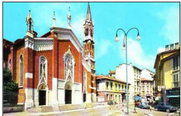
Figura 2. L'attuale chiesa di Santa Maria degli Angeli