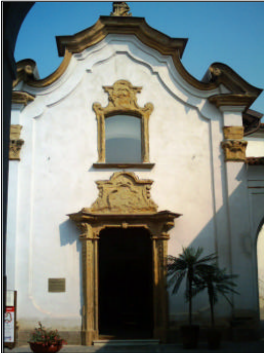
Figura 1. La facciata della chiesa intramurana di San Gerardo.

sua sede antica, opportunamente ampliata, ma nel 1784, a causa delle frequenti inondazioni, viene nuovamente trasferito nei locali dell'ex convento francescano di piazza Mercato, da poco soppresso, mentre nella vecchia sede è insediato il Monte di Pietà.