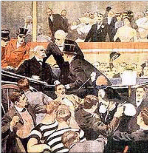
Figura 1. Umberto I soccorso subito dopo l'attentato in una illustrazione d'epoca

All'indomani del regicidio compiuto per mano dell'anarchico Gaetano Bresci il 29 luglio del 1900, tutti i quotidiani e i giornali locali dedicarono ampio spazio al tragico avvenimento che ebbe a teatro Monza e, in particolare, il campo sportivo della "Forti e Liberi" allestito lì dove oggi sorge la Cappella Espiatoria .